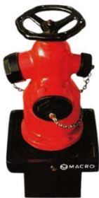
MARCO DE INCÊNDIO MACRO com saídas Storz Dn52xDn75xDn110