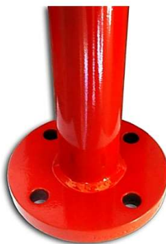
Sapatas de fixação