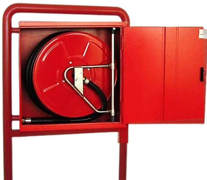
Modelo de porta