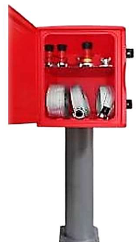
Sugestão de utilização; pedestal pintado em cinza.

Como empresa inovadora a IMPORTE S.A. reserva-se o direito de alterar especificações do produto, modelos e equipamentos padrão sem aviso prévio e sem incorrer em obrigações. Para obter mais informações visite o website www.imparte.pt ou contacte o n.dep. comercial.